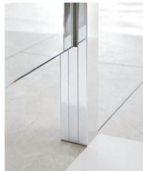
Bodenanschluss mit Bodenfreiheit